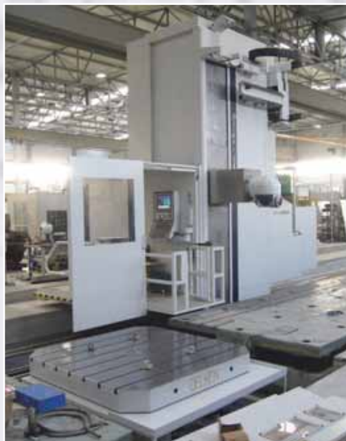
Tavola girevole CNC 2000x2000 - portata 20 ton. applicata su alesatrice a montante mobile. CNC Milling rotary table 2000x2000 – capacity load 20 Tons. applied on boring and milling machine