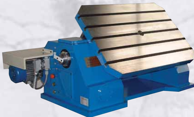
Tavola basculante 600x1000 – portata 2000 Kg