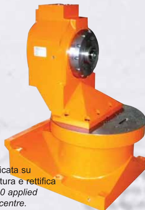
Tavola CNC \varnothing 500 applicata su centro di lavoro di fresatura e rettifica CNC Rotary table \varnothing 500 applied on milling and grinding centre.