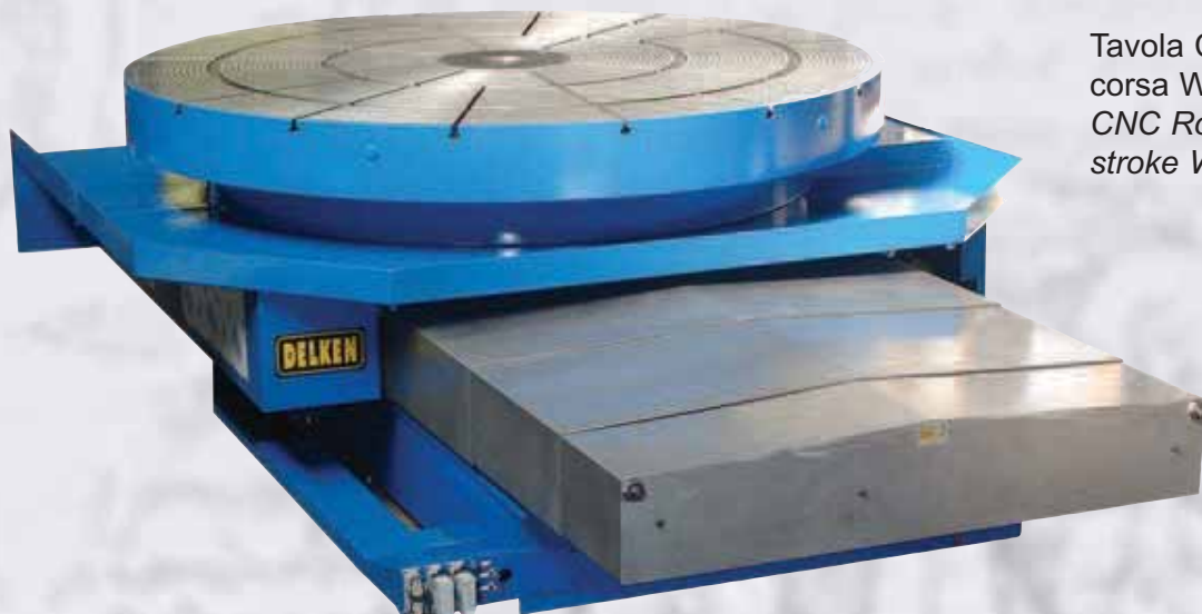
Tavola CNC \varnothing 3000 – 100 rpm corsa W 2000 – 20 Ton. CNC Rotary table \varnothing 3000 – 100 rpm stroke W 2000 – 20 Tons.