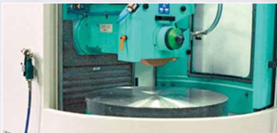
Tavola CNC \varnothing 1000 - 100 rpm applicata su macchina di rettifica CNC rotary table \varnothing 1000 - 100 rpm applied on grinding machine