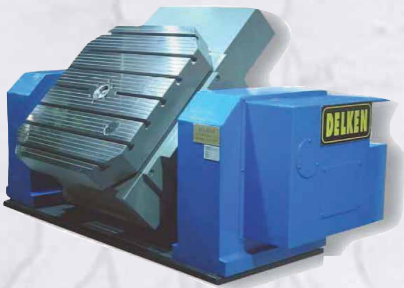
Tavola roto-basculante CNC 800x800 – portata 4000 Kg