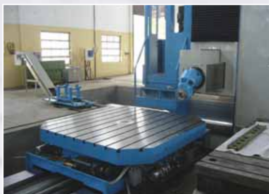
Alesatrice a montante mobile con tavola roto-traslante CNC 2500x2500 - corsa 2000 Boring and milling machine with CNC rotary and shifting table 2500x2500 – stroke 2000