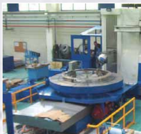
Tavola rototraslante CNC di tornitura e fresatura \varnothing 3000 corsa 2000 portata 20 Ton. applicata su alesatrice a montante mobile CNC Turning and milling rotary-shifting table \varnothing 3000 stroke 2000 capacity load 20 Tons, applied on boring and milling machine

Tavola rototraslante CNC di tornitura e fresatura 1200x1200 corsa 2500 portata 7 Ton. applicata su alesatrice. CNC milling rotary-shifting table 1200x1200 stroke 2500 capacity load 7 Tons, applied on milling machine