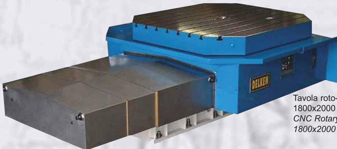
Tavola roto-traslante CNC 1800x2000 corsa W 1250 CNC Rotary and shifting table 1800x2000 stroke W 1250