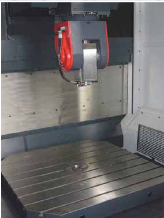
Centro di lavoro con tavola orizzontale 1500x1500 Machining centre with horizontal table 1500x1500