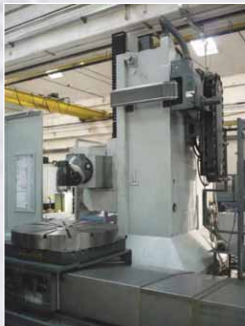
Tavola rototraslante CNC di tornitura e fresatura 1200x1200 corsa 2500 portata 7 Ton. applicata su alesatrice. CNC milling rotary-shifting table 1200x1200 stroke 2500 capacity load 7 Tons, applied on milling machine

Tavola girevole CNC 2000x2000 - portata 20 ton. applicata su alesatrice a montante mobile. CNC Milling rotary table 2000x2000 – capacity load 20 Tons. applied on boring and milling machine