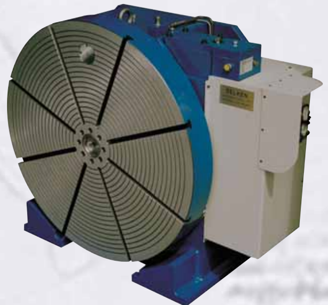
Tavola girevole ad asse verticale/orizzontale ø 800 Rotary table with vertical /horizontal axis ø 800