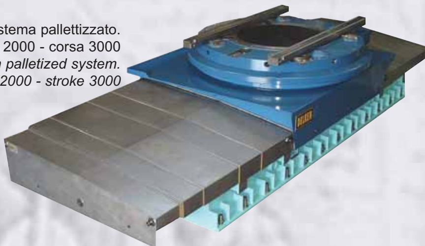
Tavola roto-traslante CNC con sistema palletizzato. Pallet \varnothing 2000 - corsa 3000 CNC rotary and shifting table with palletized system. Pallet \varnothing 2000 - stroke 3000