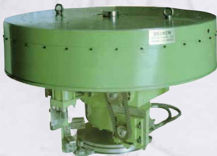
Tavola girevole ø 1500 a posizioni fisse applicata su macchina speciale a trasferta