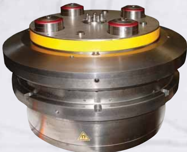
Tavola da incasso CNC con sistema pallettizzato \varnothing 800 CNC Rotary table with palletized system \varnothing 800