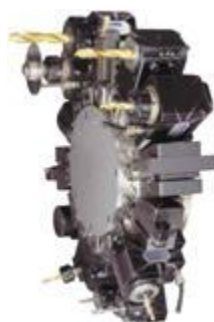
ALLA TYPER AV VERKTYGSHÅLLARE TILL ER CNC-SVARV