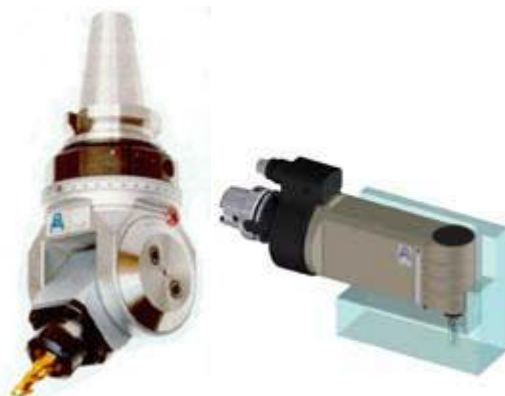
VINKELHUVUDEN & VARVTALSHÖJARE