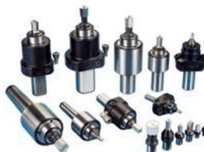
DRIFTA ex. 4-KANT, 6-KANT, TORX SNABBT & ENKELT