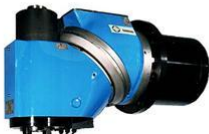
FRÄSHUVUDEN MANUELLA & STYRDA